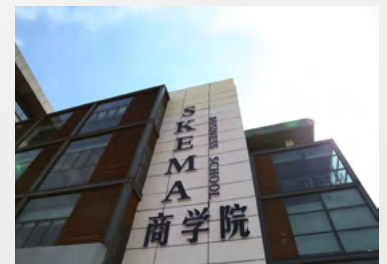
Campus de Suzhou