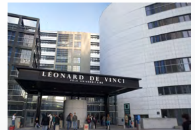
Campus de Paris