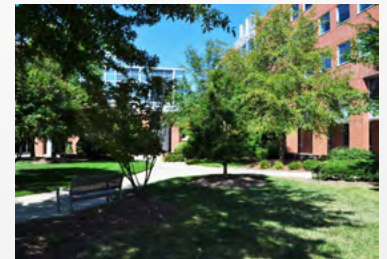
Campus de Raleigh